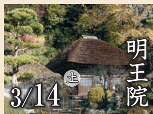
明王院 3/14 土