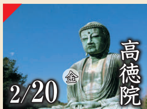
高德院 2/20 金