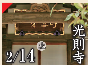
光則寺 2/14 土