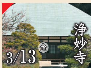
浄妙寺 3/13 金