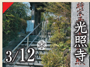
時宗寺 光照寺 3/12 木