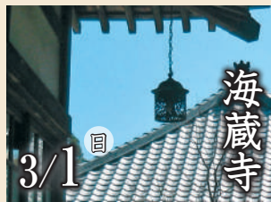
海蔵寺 3/1 日