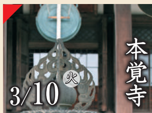
本覚寺 3/10 火