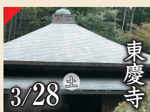
東慶寺 3/28 土