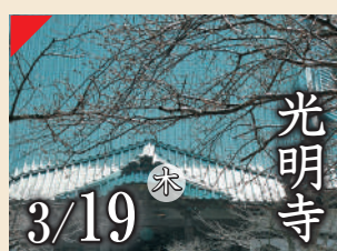
光明寺 3/19 木