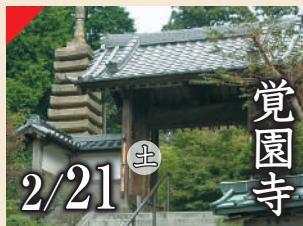
覚園寺 2/21 土