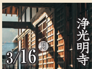
浄光明寺 3/16 月