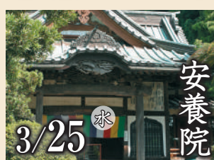
安養院 3/25 水