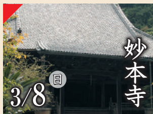
妙本寺 3/8 日