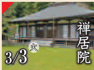
禅居院 3/3 火