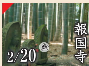
報国寺 2/20 金