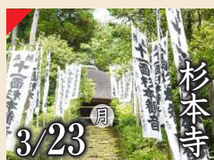
杉本寺 3/23 月