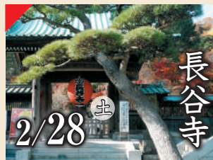
長谷寺 2/28 土