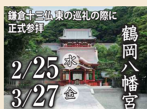
鎌倉十三仏東の巡礼の際に正式参拝 2/25 水 3/27 金

マークがついた社寺の参拝は事前申込が必要です。マークのない社寺は当日受付順となりますが、ホームページから事前予約も承っております。詳しくは内面をご覧ください。