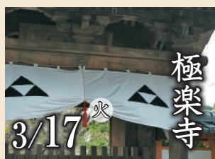
極楽寺 3/17 火