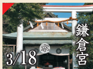
鎌倉宮 3/18 水