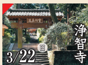
浄智寺 3/22 日