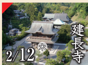
建長寺 2/12 木