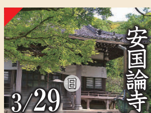
安国論寺 3/29 日