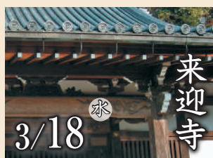
来迎寺 3/18 水