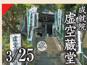
成就院 虚空蔵堂 3/25 水