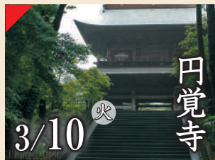
円覚寺 3/10 火